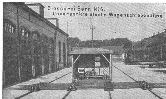
Giesserei Bern N°6. Unversenkte electr. Wagenschiebebühne

Hebezeuge jeder Art als: Laufkräne, und feste od. fahrbare Drehkräne für Hand- und speziell elektrischen Betrieb; Aufzüge für hydraulischen, elektrischen, und Transmissionsbetrieb.