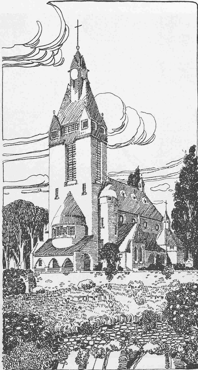
Abb. 2. Evangelische Kirche zu Wiesa in Sachsen. Entwurf von Schilling & Graebner , Architekten in Dresden.