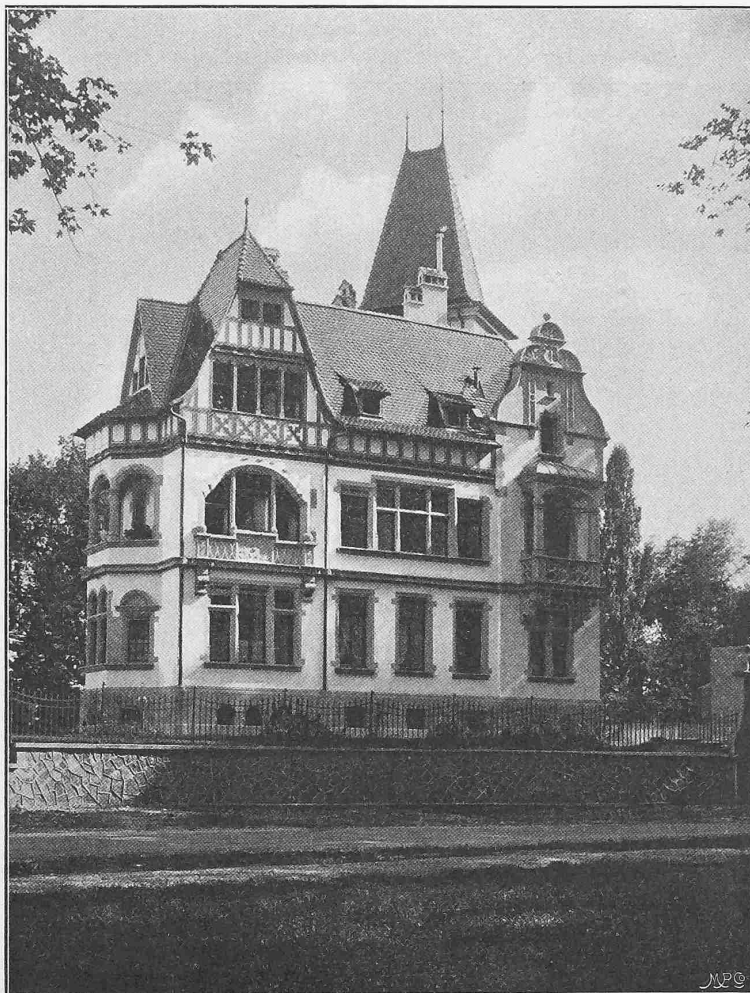
Abb. 1. Ansicht gegen die städtische Anlage.

Die Malz-Silos der Aktienbrauerei zum Löwenbräu in München, die zur Zeit von der Firma Eisenbeton G. m. b. H., abweichend von dem ältern Gebrauch derartige Getreide- und Malzspeicher in Holz, in Eisen und Holz oder in Eisen allein zu erstellen, in Eisenbeton erbaut werden, sollen zur Aufnahme von 37500 hl Malz in 18 Zellen von je 16 m mitt-