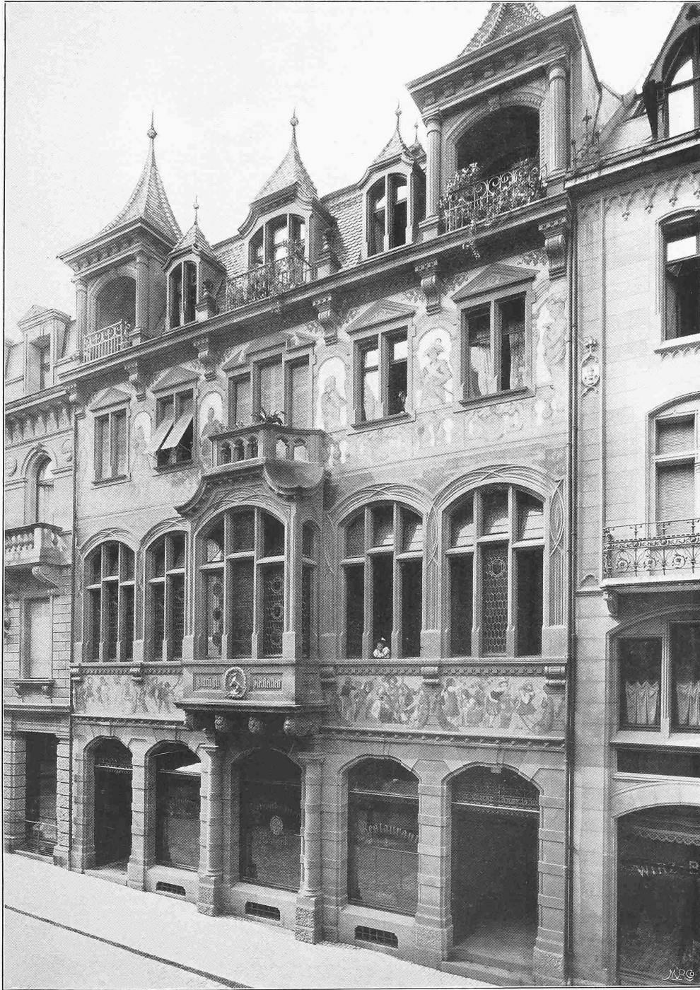
Die Freie Strasse in Basel. — „Zunft zu Rebleuten“.

Architekten: La Roche, Stähelin & Cie. in Basel.