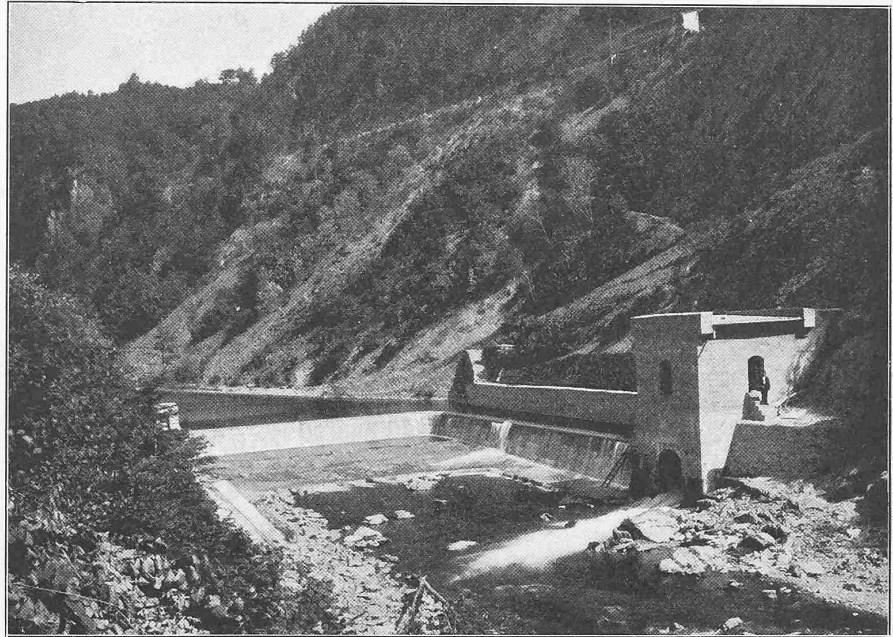
Abb. 3. Ansicht der Wehranlage.

An der rechtseitigen Wehrwand wurde eine gemauerte Fischtreppe angebracht (Abb. 9) in der bekannten Bauart mit treppenartig aufsteigenden Sprungbecken von 1,30 m Länge, 0,80 m Breite und 0,60 m Wassertiefe. Die Springhöhe beträgt 0,32 m. Die rechtseitige Flusswand unterhalb der Fischtreppe ist durch eine Böschungspflasterung, die auf einem Betonfundament ruht, gegen die Angriffe der scharfen Strömung gesichert.