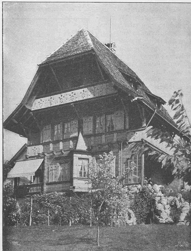
Fig. 41. Chalet Roussy à la Belotte. — Architecte: M. Edmond Fatio.

Regelflächen, die durch eine einzige Leitkurve bestimmt werden. Die Berechnung ist einfach, und es ist leicht genug, für die Schaufelung Vorschriften aufzustellen und Regeln zu geben, die es auch dem Anfänger ermöglichen, ohne besondere Mühe brauchbare Ergebnisse zu erzielen. Bei den modernen Formen der Francis-Turbine, in denen das Wasser mehr oder weniger vollständig nach der Richtung der Achse abgelenkt wird, gestaltet sich die Sache viel verwickelter. Die Bahnen der einzelnen Wasserfäden weichen überaus stark von einander ab; es muss darum gewissermassen jeder Wasserfaden für sich betrachtet und behandelt werden. Die Schaufeln erhalten eine ziemlich komplizierte, doppelt gekrümmte Gestalt, die nicht mehr durch einfache geometrische Hilfsmittel bestimmt werden kann und darum an den Entwerfenden grössere Anforderungen stellt.