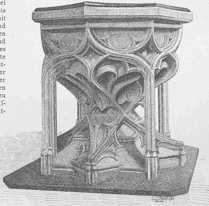
Abb. 8. Taufstein in der Kirche zu Biel, vom Jahre 1492.