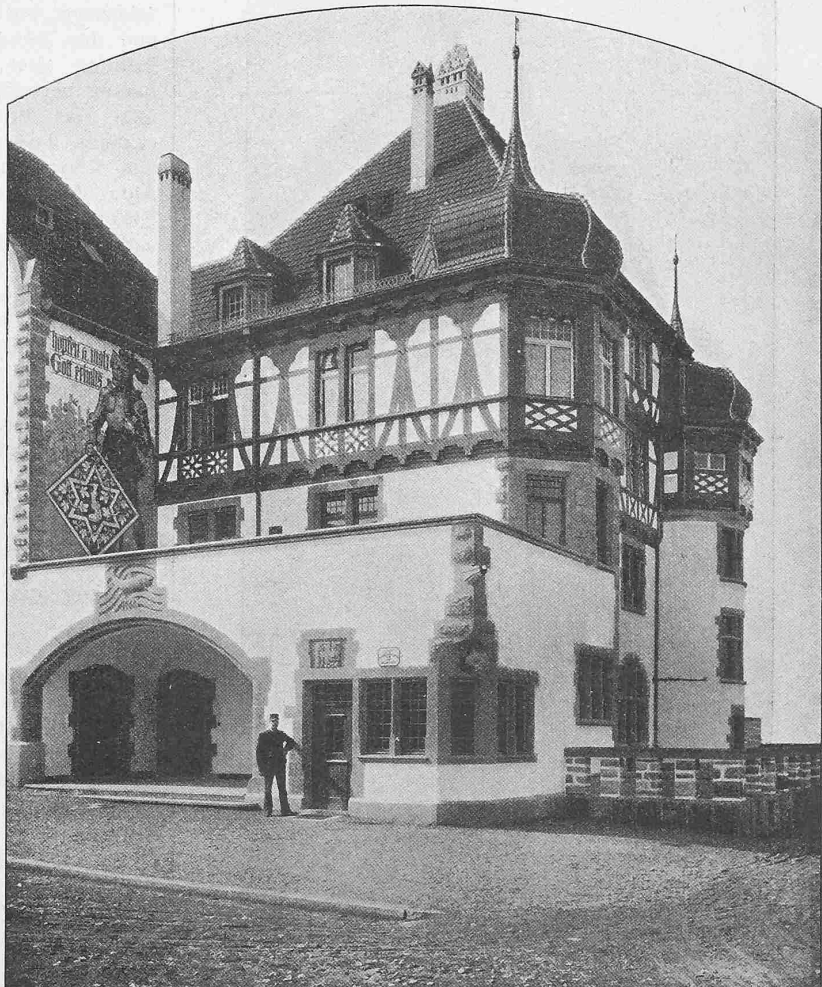
Abb. 1. Ansicht von Nordosten.

Im Erdgeschoss befinden sich zunächst die Räume zur Aufnahme der verschiedensten Kostgänger. Mit der breiten Rheinterrasse steht das Neben- oder Damenzimmer in Verbindung, mit rotgestrichenem Täfelwerk und Möbeln, roter Tapete und weisser, stuckverzierter Decke. An den Wänden hängen gute Bilder, Reproduktionen nach Böcklin und Stuck, sowie Originale der Karlsruher Künstlerbund-Druckerei. Neben diesem Raume liegt das Herrenzimmer (Abb. 6 S. 119) mit blaugebeiztem, hohem Getäfel und blaugebeizter Rahmendecke mit gemalten Rosetten, während über dem Getäfel sich ein weisser Fries mit Geweihen und Bildern hinzieht. Ein ausgebauter Erker bietet den „Auserwählten“ angenehme Sitzgelegenheit. — Es darf an dieser Stelle nicht unerwähnt bleiben, dass, wie es hier geschehen ist, eine ganze Anzahl von Brauereibesitzern nicht wenig zur Entwicklung der neuern Innenarchi-