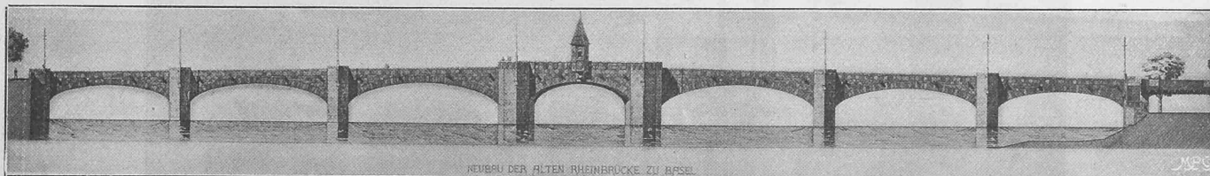
NEUBAU DER ALTEN RHEINBRÜCKE ZU BASEL

Die Stationen sind teils eigentliche Bahnhöfe für vollen Verkehr, teils Haltestellen, die nur dem Personenverkehr dienen. Von den erstern bilden die grösseren Bahnhöfe, Hütteldorf, Heiligenstadt und Hauptzollamt, die Eckpunkte des Stadtbahnnetzes, wo die Stadtbahn-Züge formiert werden und anderseits an die Fernbahnen anschliessen. Kleinere Bahnhöfe befinden sich in Gersthof, Hernals und Ottakring.