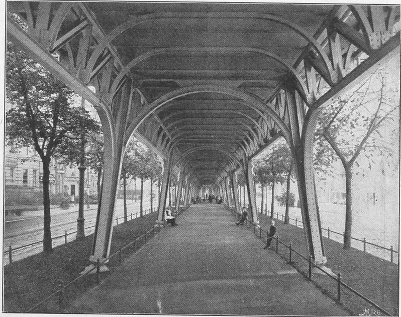
Abb. 11. Der Viadukt in der Bülowstrasse.

Besonderes Aufsehen erregt die elektrische Hauptschachtfördermaschine, die für die Gelsenkirchener Bergwerks-A.-G. von der Friedr. Wilhelms-Hütte in Mülheim a. Rh. und Siemens & Halske in Berlin gebaut worden ist. Zwei Gleichstrom-Elektromotoren von je max. 1400 P. S. Leistung treiben die Koescheibe von 6 m Durchmesser an. Die ökonomische Verwertung der elektrischen Energie wird durch eine Pufferbatterie erreicht, welche in vier Gruppen geteilt nach und nach so eingeschaltet wird, dass die Spannung Beträge von 125, 250, 375 und 500 Volt annimmt. Die Reihenfolge der Einschaltung wechselt gleichmässig ab, sodass die Anstrengung der einzelnen Elemente eine tunlichst gleichmässige ist. Die Erfahrung wird lehren ob die Stimmen recht behalten, die es als Wagnis bezeichnen, mit einem neuen System an so grosse Erstlingsausführungen zu schreiten; auf der Ausstellung erwies sich die Handhabung der Maschine als äusserst bequem und sicher.