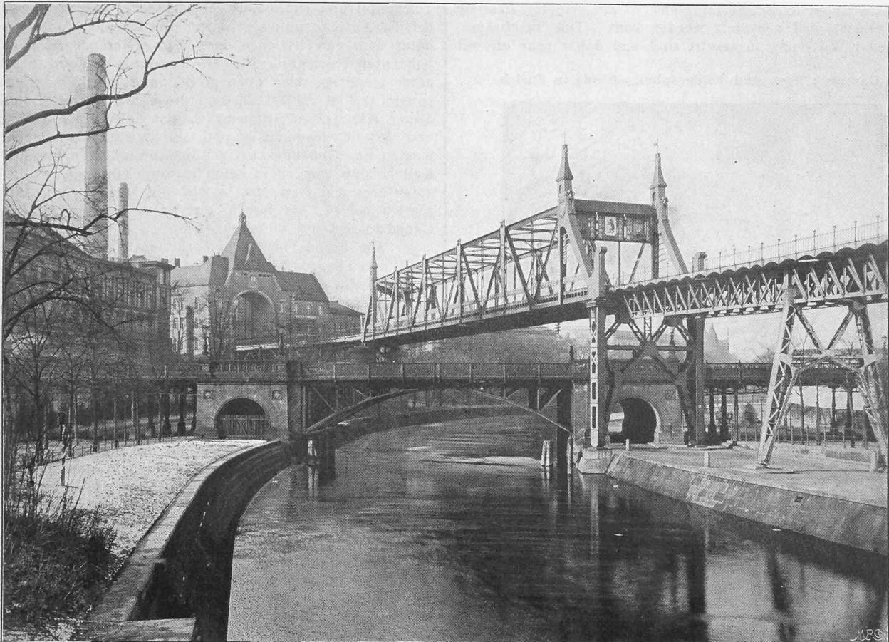
Abb. 15. Ueberbrückung des Landwehrkanals und der Anhalterbahn.

zu sein und der Zweitakt hat noch die schwierige Aufgabe zu lösen die etwas grosse Arbeit der Luft- und Gaspumpe einzuschränken.