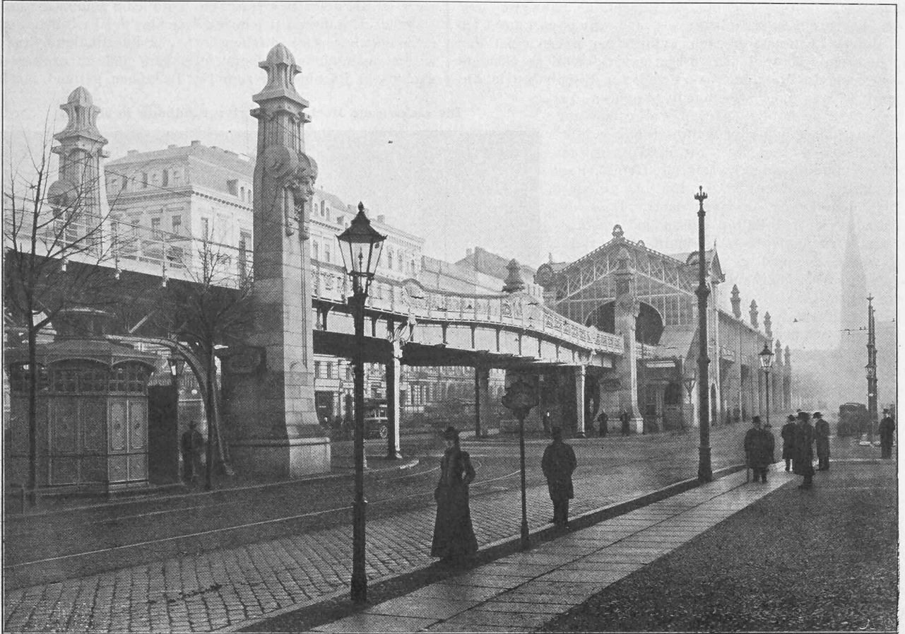
Abb. 13. Haltestelle « Bülowstrasse ».