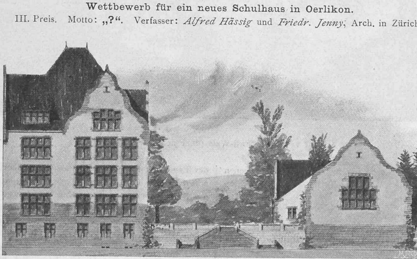
Nordfassade gegen die Hochstrasse. 1:500.

Der Betriebsvoranschlag weist für den zwölf Zellen-Betrieb eine jährliche Gesamtausgabe von 131967 Fr. auf, der 41220 Fr. Einnahmen gegenüberstehen; der 90747 Fr. betragende Ausgabenüberschuss wird durch den Ertrag der Kehrichtabfuhrtaxe und die Entschädigung des Strassenwesens für die Verbrennung des Strassenkehrichts hinlänglich gedeckt. Die Beseitigung des Kehrichts durch landwirtschaftliche Verwertung kostete in den letzten vier Jahren in Zürich durchschnittlich 6,15 Fr. per t, durch Verbrennung wird sie zunächst auf Fr. 6,78 zu stehen kommen, welche