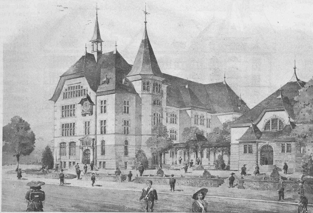
I. Preis. Motto: «Süd-Ost-Licht». Verfasser: Ernst Fröhlicher, Architekt in Solothurn. Perspektive.

britannien 2, Italien 3, Japan 4, Monaco 1, die Niederlande 4, Norwegen 1, Oesterreich 20, Paragnay 1, Rumänien 3, Russland 5, Schweden 3, die Schweiz 1, Spanien 3, die Türkei 1, Ungarn 9, die Vereinigten Staaten von Amerika 3. Dazu kamen die zahlreichen Vertreter von Behörden, Körper-