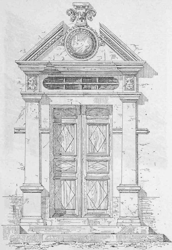
Zeichnung v. Arch. P. Ulrich.