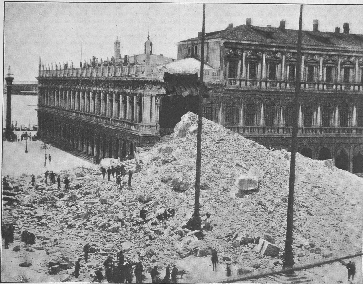
Nach einer Photographie.