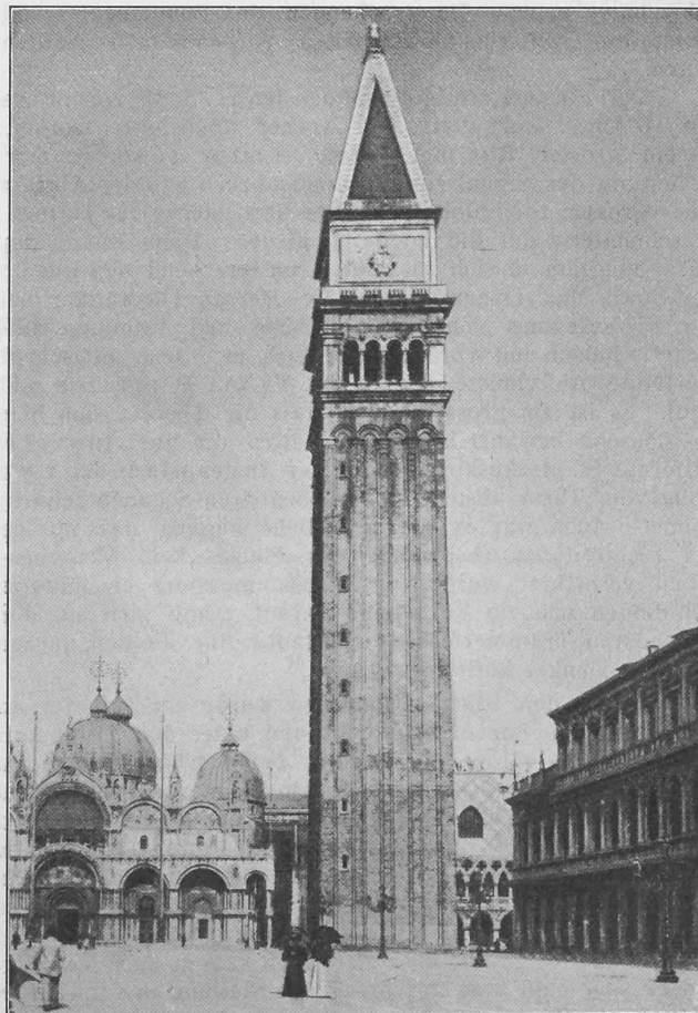
Ansicht des Turmes von der Piazza San Marco aus.

Sämtliche Entwürfe sind im Saale der Brauerei Oerlikon, von Sonntag 20. Juli bis Samstag 26. Juli, je vormittags von 8—12 und nachmittags von 1—7 Uhr öffentlich ausgestellt.