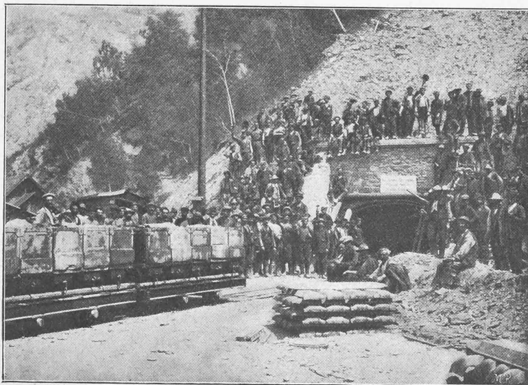
Abb. 47. Nordseite. — Eingang von Tunnel II (Sommer 1899).