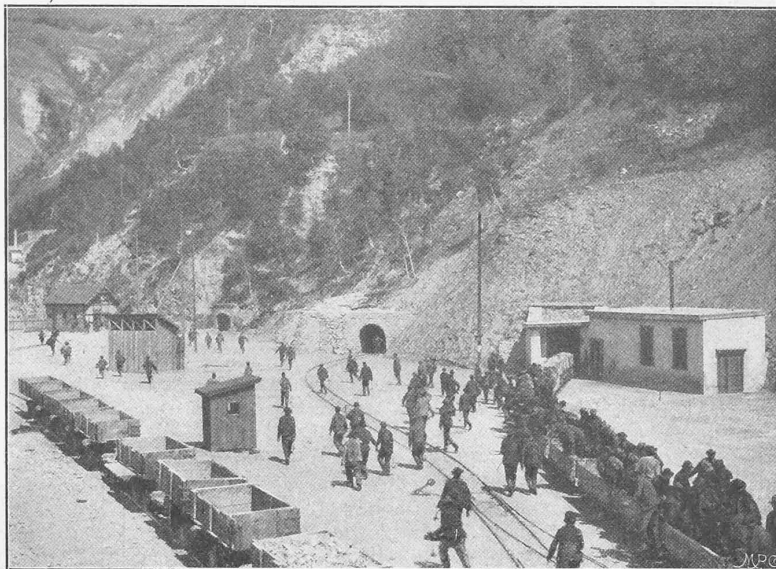
Abb. 46. Mündungen von Richtstollen, Tunnel I und Tunnel II (Nordseite) mit Arbeiterzug aus Tunnel II kommend. (Sommer 1900.)

Unterbauarbeiten bereits ausgeführt worden, womit wir uns aber nicht weiter befassen; es genüge die Bemerkung, dass sich diese Anlagen östlich vom jetzigen Bahnhof in einer Länge von etwa 1 km der Rhone entlang erstrecken werden und dass das ganze Bahnhofplanum mit dem Ausbruchmaterial des Tunnels angeschüttet werden soll. — Eine Ansicht der Fundament- und Unterbauten der neuen Lokomotivremise ist in Abb. 42 gegeben. — Diese Bahnbauten