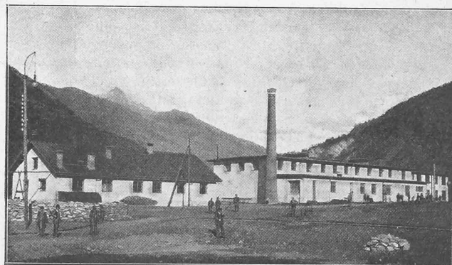
Abb. 45. Nordseite. — Stationsgebäude beim Tunnelleingang.

Dieses Geleise zieht sich längs der Südgrenze des zukünftigen Bahnhofes, zuerst auf einem Damm in der Ebene, später dem Fuss der Berglehne entlang, berührt das Cement- und Kalkmagazin und endigt bei den Kohlenschuppen; seine Länge beträgt 1800 m. Parallel damit läuft eine Zufahrtstrasse, die unten bei der Rhonebrücke in die Furkastrasse ausmündet und vor dem Installationsplatz eine weitere, gleichfalls neu erstellte Strasse vom oberen Teil der Ortschaft Brig her aufnimmt. Die Trans-