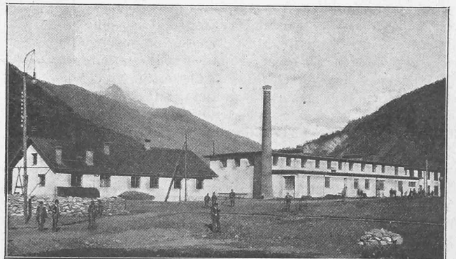
Abb. 45. Nordseite. — Stationsgebäude beim Tunnelleingang.

Dieses Geleise zieht sich längs der Südgrenze des zukünftigen Bahnhofes, zuerst auf einem Damm in der Ebene, später dem Fuss der Berglehne entlang, berührt das Cement- und Kalkmagazin und endigt bei den Kohlenschuppen; seine Länge beträgt 1800 m. Parallel damit läuft eine Zufahrtstrasse, die unten bei der Rhonebrücke in die Furkastrasse ausmündet und vor dem Installationsplatz eine weitere, gleichfalls neu erstellte Strasse vom obern Teil der Ortschaft Brig her aufnimmt. Die Trans-