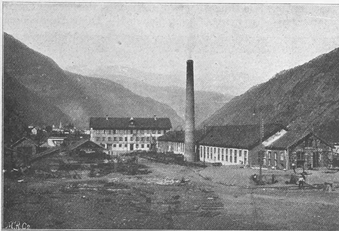
Abb. 44. Installationsplatz der Nordseite. — Maschinenhaus und Bureaux.

Näher beim Tunnelleingang und mit beiden Mündungen durch einen gedeckten Gang verbunden, steht das zweite Hauptgebäude oder das Stationsgebäude (Abb. 45); dieses besteht aus zwei getrennten Teilen und enthält einerseits die Bad- und Dusche-Räume (auf die wir später noch näher zu sprechen kommen), die Restauration, die Wäscherei nebst Trocknerei und das Dampfkesselhaus, sowie die Aborte, anderseits das Bureau für die Kontrolle der Arbeiter nebst kleiner Infirmerie, eine Metallgiesserei und ein Magazin für Notvorräte. Ferner befindet sich am Eingang zum Stollen II ein provisorisches Ventilationsgebäude (Abb. 46 S. 25), neben dem Portal von Tunnel I ist das definitive Ventilationsgebäude und weiter flussaufwärts, etwas in der Höhe das Dynamitmagazin errichtet.