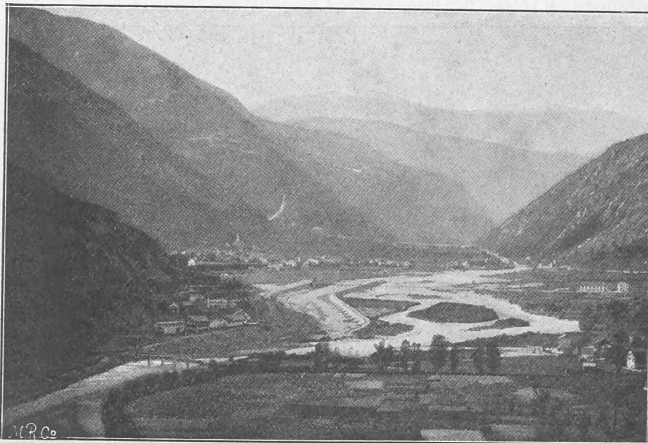
Abb. 41. Nordseite. — Ansicht des Installationsplatzes von Osten.

beiden Gemeinden liegt auf dem nach Osten abfallenden Seegelande, dessen bereits starke Ueberbauung allein schon die Plazierung von Neupunkten schwierig machte. Von den drei in Frage kommenden trigonometrischen Ausgangspunkten auf der Albiskette ist dieses Gelände nicht sichtbar, und am rechten Ufer des Zürichsees, von wo aus ein Vorwärtseinschneiden von Punkten über den See sehr günstig ist, liegen die kantonalen Punkte so, dass sie unter sich nicht gesehen werden können. Unter diesen Umständen