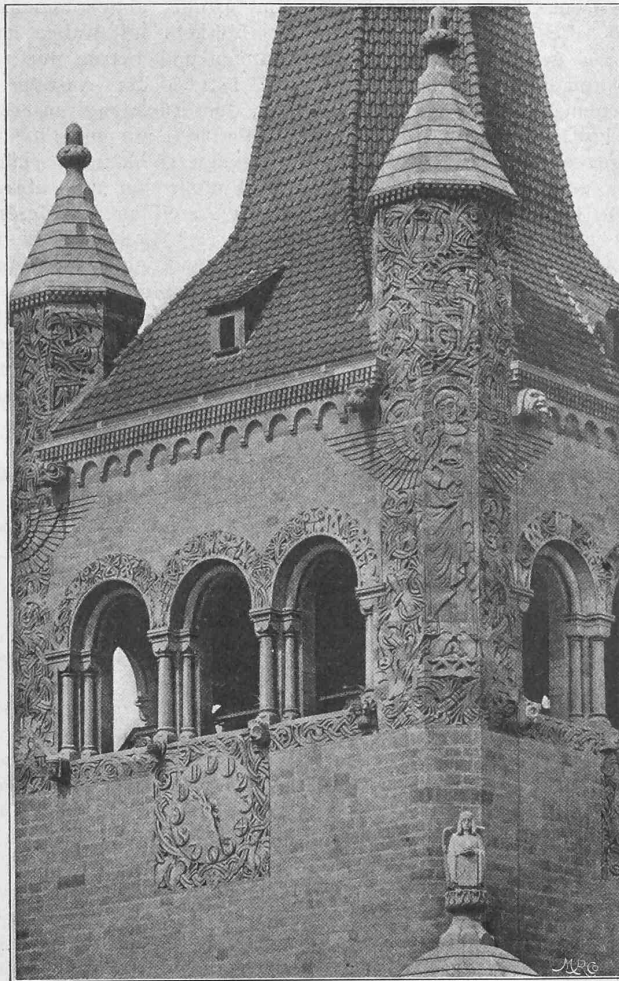
Die neue St. Paulus-Kirche zu Basel. — Turmansicht.

gleiterscheinungen an verschärfter Konkurrenz und vermehrten Schwierigkeiten von Seite der Käufer. Auch jene Zweige der schweizerischen Maschinen-Industrie, die eine gesteigerte Ausfuhr aufweisen, hatten unter diesen Verhältnissen zu leiden.