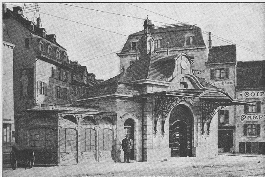
Abb. 1. Vorderansicht.

briquesystem zur Anwendung gelangt. Die Untergeschossmauern und Fundamente sind in Beton ausgeführt, die Aborträume und deren Teilungswänden mit weissem englischen Cement glatt verputzt, die Betonwände des Treppenhauses und des Pissoirraumes mit Civerwandplättchen verkleidet.