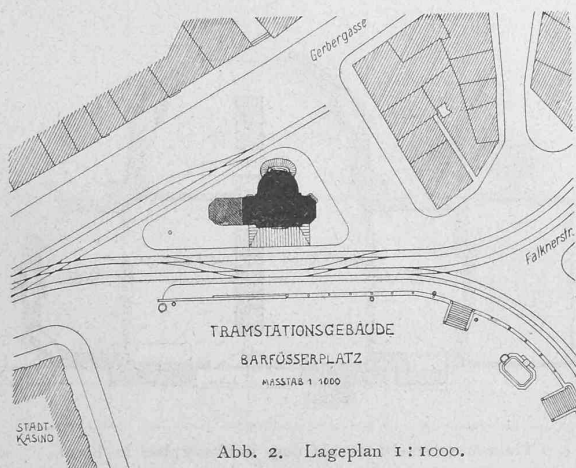
Abb. 2. Lageplan 1:1000.

Ein mit dem weiteren Ausbau der elektrischen Strassenbahnen im Innern der Stadt wünschbar gewordenes Stations-