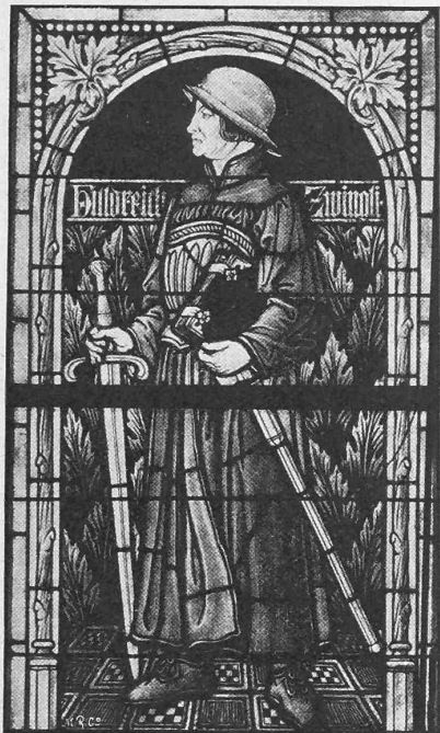
Abb. 8. Zwinglifenster.

Glasgemälde von A. Lüthi in Frankfurt a. M.