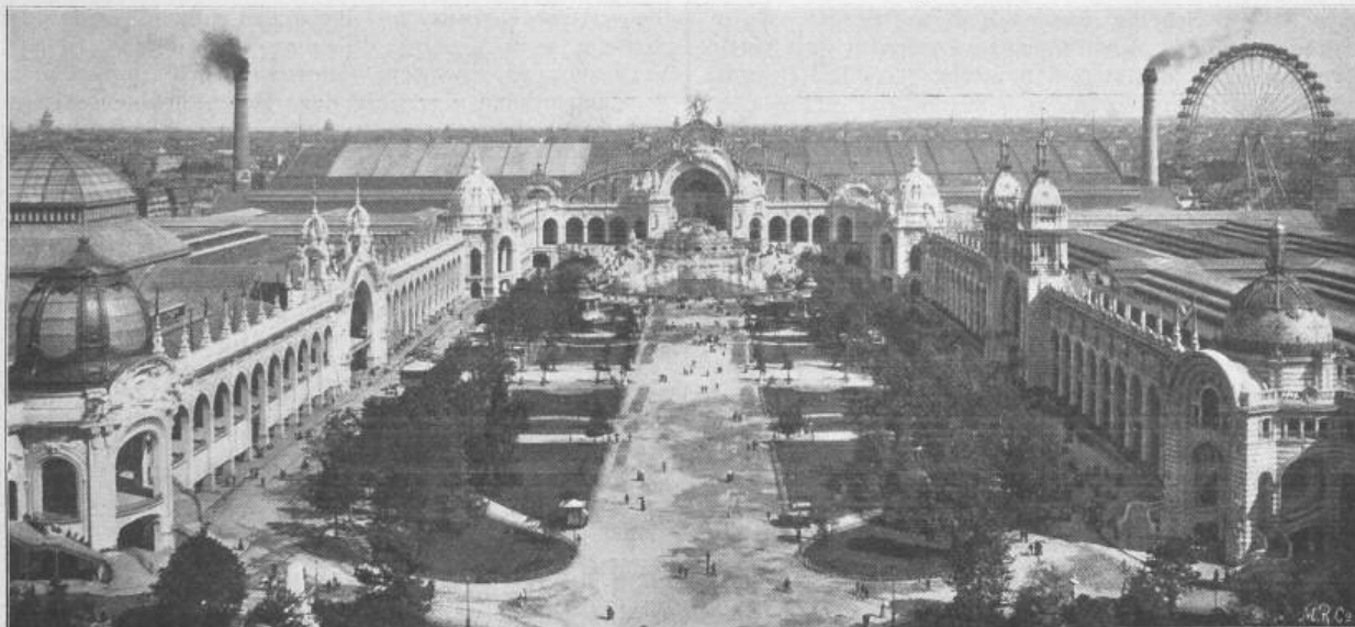
Fig. 37. Das Marsfeld, von der ersten Galerie des Eiffelturms aus gesehen.