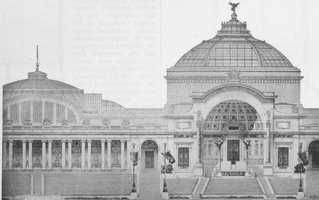
Aus dem Bénard-Album .

I. Preis. Entwurf von Arch. Emile Bénard in Paris.