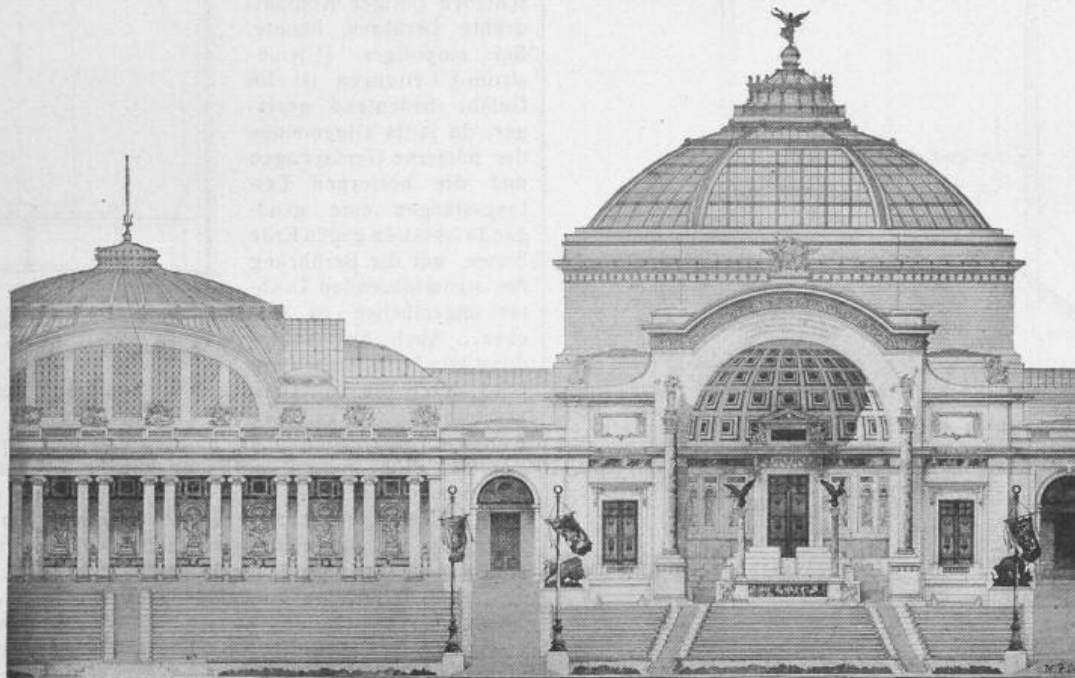
Aus dem Bénard-Album.