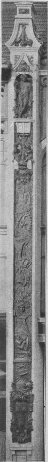
D. B. Fig. 67. Pfeilerrelief am Mittelbau der Hauptfront.