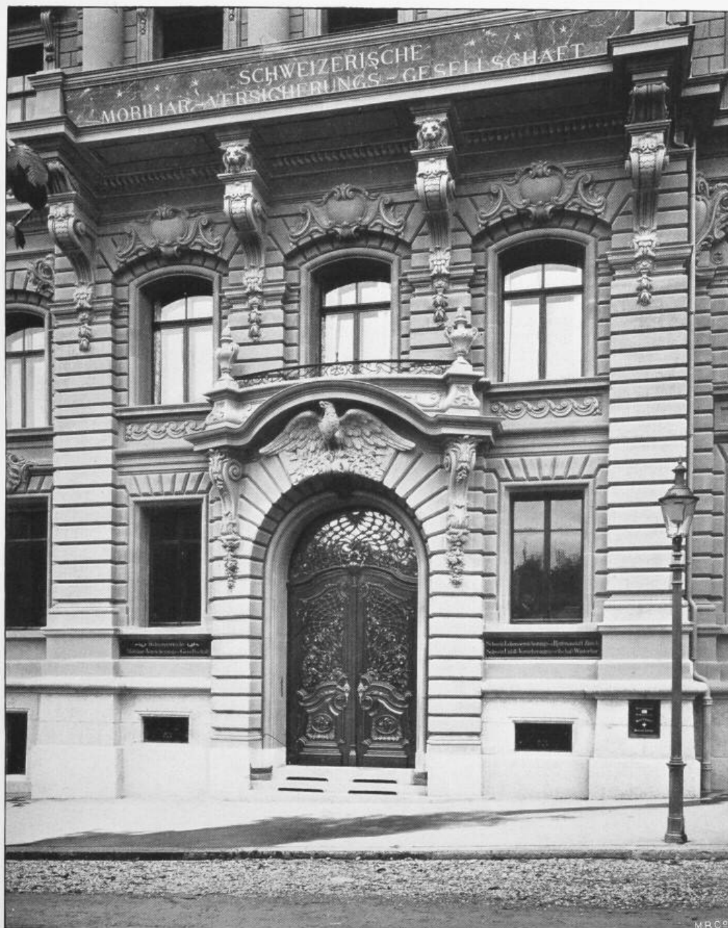
Verwaltungsgebäude der Schweizerischen Mobiliar-Versicherungs-Gesellschaft in Bern.

Architekten: Lindt & Hünérwadel in Bern.