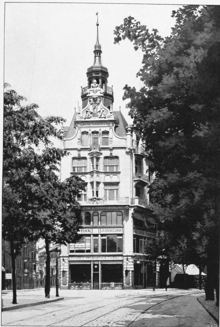
Das Haus zur „Trülle“ in Zürich.

Architekten: Pflegard & Häfeli in Zürich.