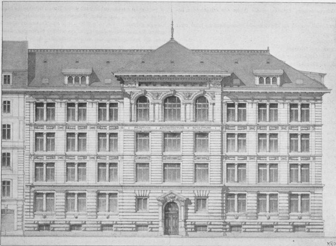
Hauptfassade der Kunstschule. 1:300.

III. Preis. Entwurf von Henri Juvet , Architekt in Genf.