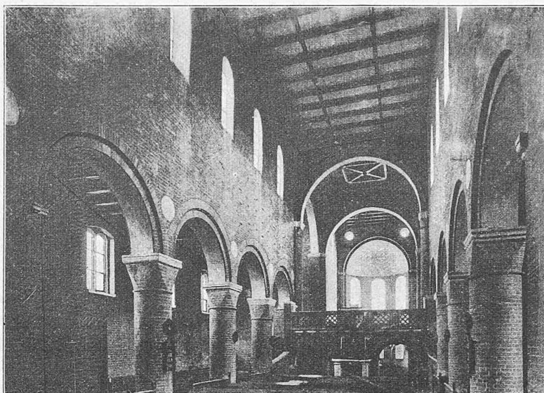
Fig. 18. Klosterkirche zu Jerichow.