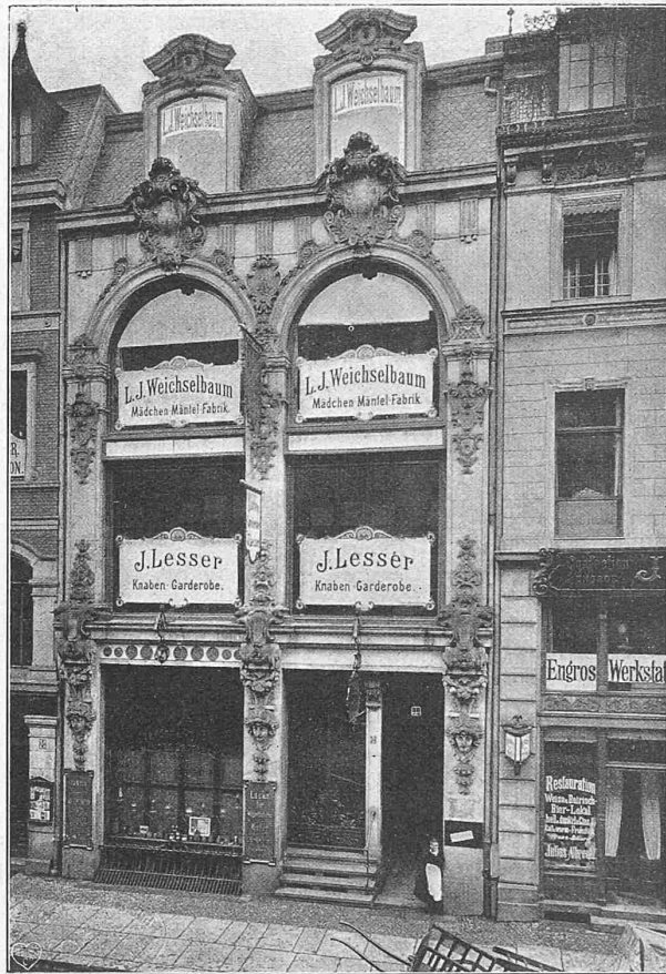
Fig. 15. Warenhaus Kurstrasse 36.

Architekten: Alterthum & Zadeck in Berlin.