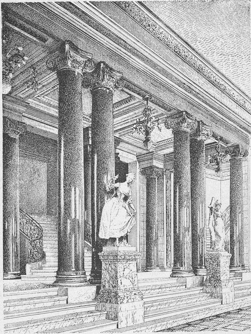
Fig. 6. Ansicht der Kolonnade im grossen Vestibül.