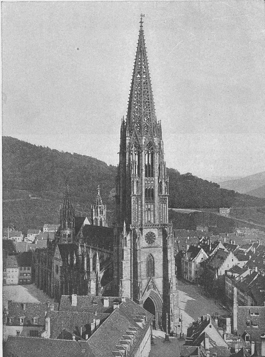
Westliche Ansicht (vom Turme der St. Martinskirche gesehen).