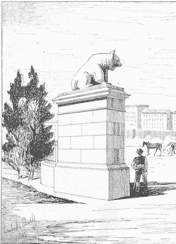
Bär am Haupteingang.

Architekten: Lambert & Stahl in Stuttgart.