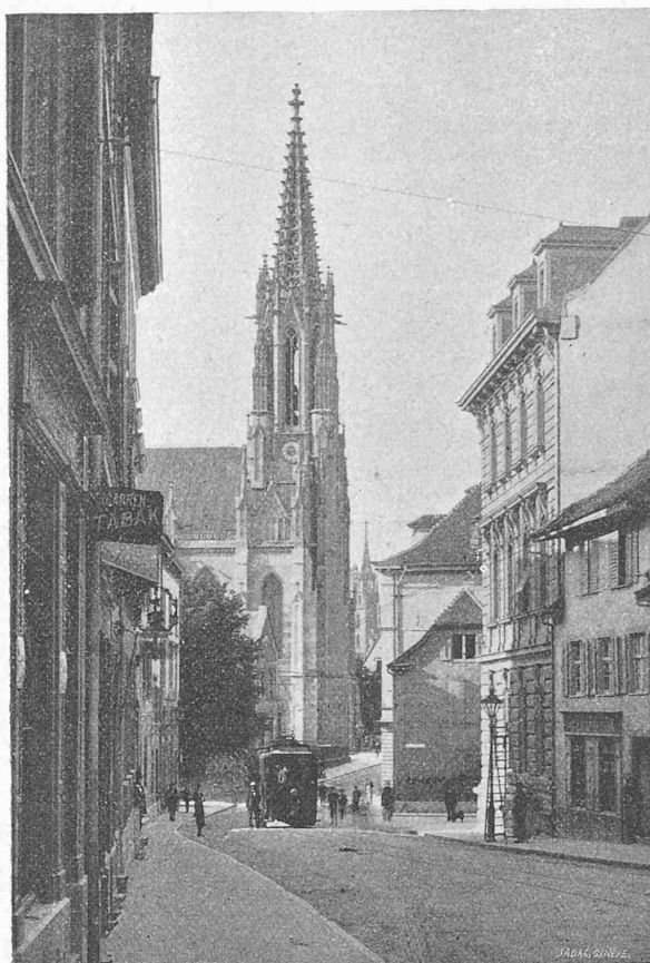
Fig. 12. Ansicht der Elisabethenstrasse.