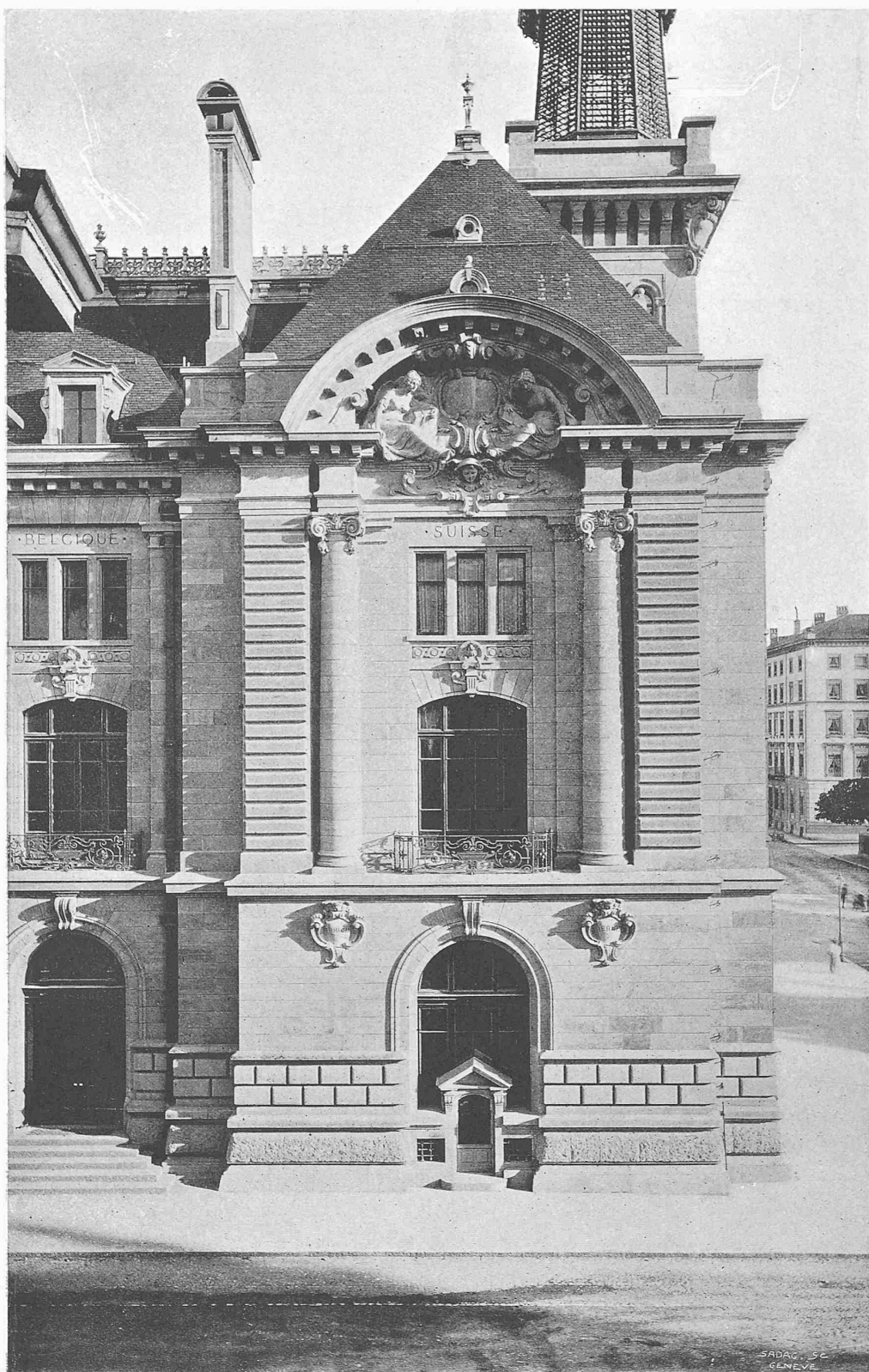
Nouvel Hôtel des Postes et Télégraphes à Neuchâtel.

Architectes: MM. J. Béguin, Alfred Rychner, E. Prince à Neuchâtel.