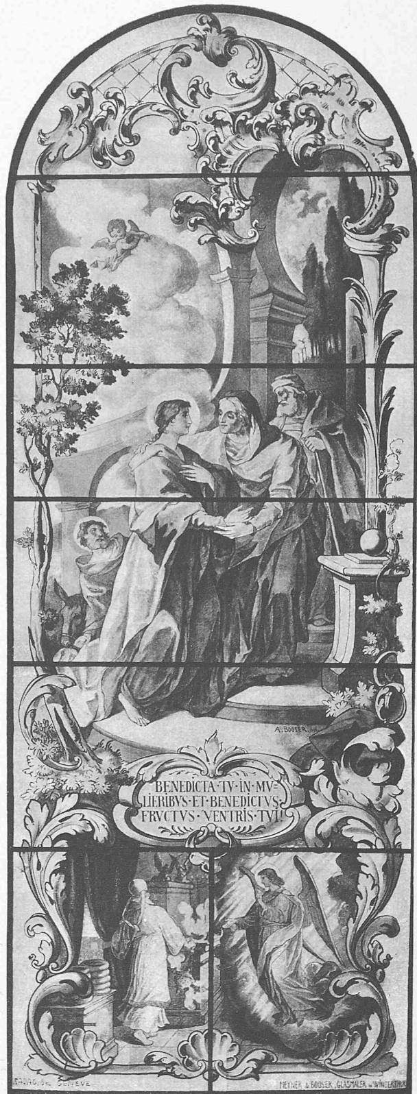
Glasgemälde für die Gnadenkapelle des Klosters Mariastein im Kanton Solothurn.

Entworfen, gezeichnet und in Glas ausgeführt von Meyner & Booser in Winterthur.