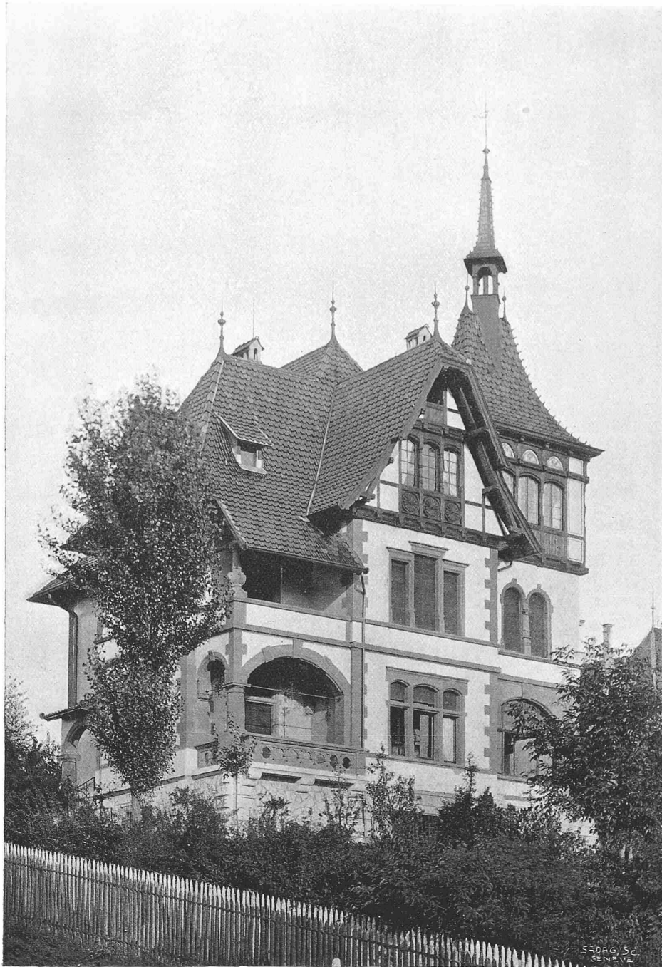
Villa Hämig beim Tiefenbrunnen in Zürich V.

Architekten: Kuder & Müller in Zürich und Strassburg i. E.