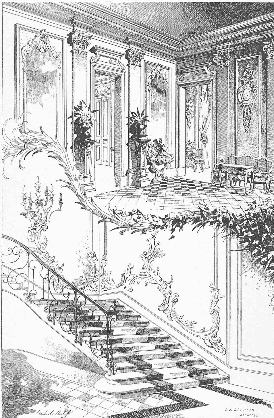
Vestibule und Treppenhaus.

Villa Stehlin-Burckhardt an der St. Alban-Anlage zu Basel.