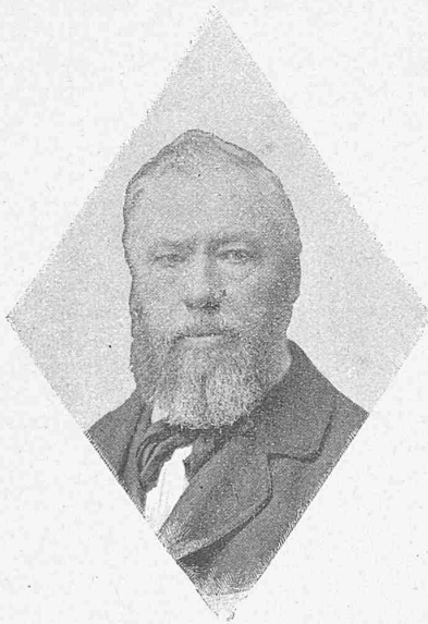
Prof. Johannes Scherr.