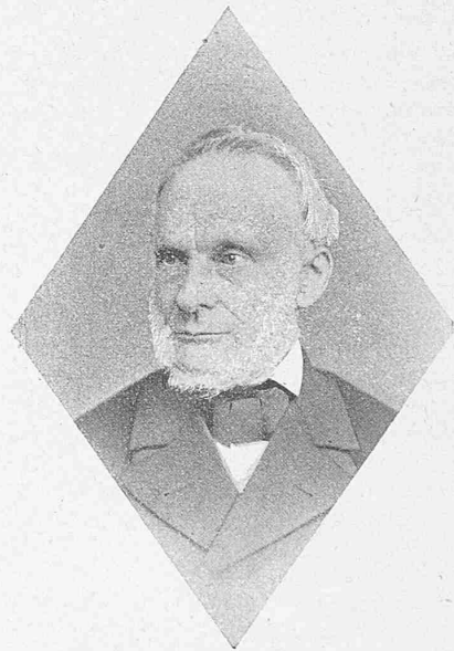
Prof. Rudolf Clausius.