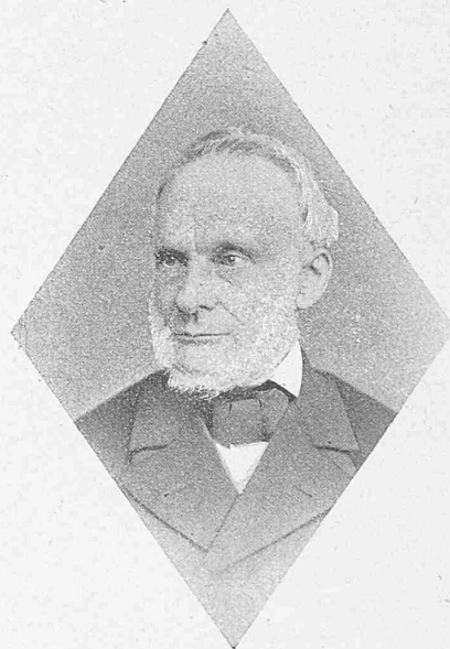
Prof. Rudolf Clausius.