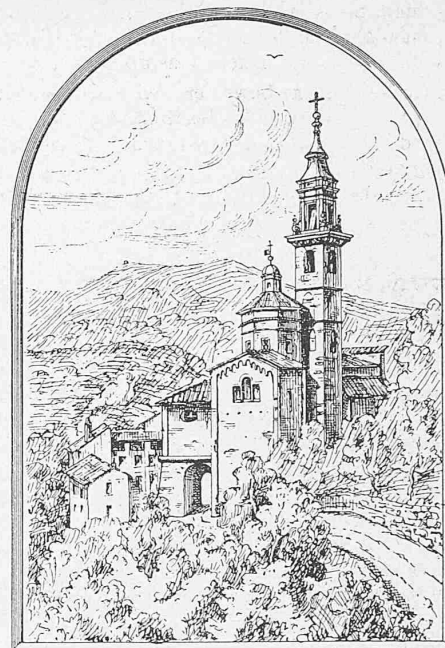
Nach einer Federzeichnung von Arch. F. Kühn.

Bombe viel zu teuer war. Sie bestand aus 1\frac{1}{2} kg Platin, so dass der Preis auf 5—6000 Fr. zu stehen kam. Seit der Einführung der Mahler'schen Bombe sind die Aussichten anders. In Frankreich, Holland, Belgien, Deutschland, Oesterreich, Amerika, England, Japan und jetzt auch hier in der Schweiz sind solche Bomben