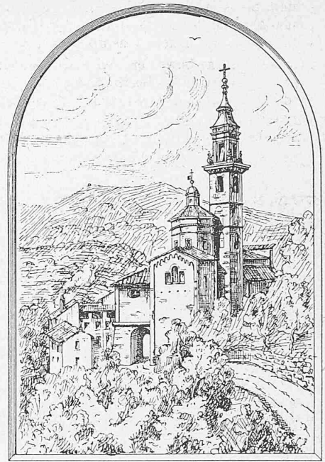
Nach einer Federzeichnung von Arch. F. Kühn. Carona bei Lugano.

Bertelot'sche Bombe viel zu teuer war. Sie bestand aus 1\frac{1}{2} kg Platin, so dass der Preis auf 5-6000 Fr. zu stehen kam. Seit der Einführung der Mahler'schen Bombe sind die Aussichten anders. In Frankreich, Holland, Belgien, Deutschland, Oesterreich, Amerika, England, Japan und jetzt auch hier in der Schweiz sind solche Bomben