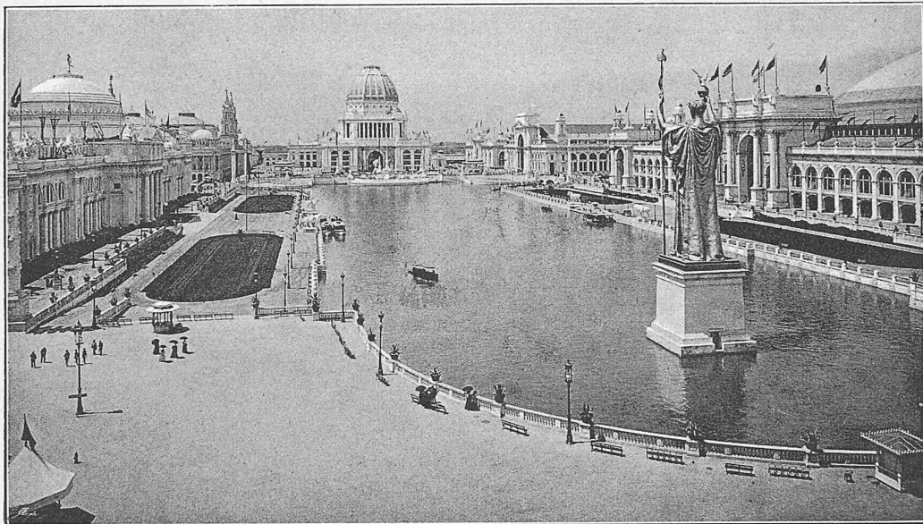
Ackerbauhalle. Maschinenhalle. Verwaltungsgeb. Bergbauh. Elektrizitätsh. Statue d. Freiheit. Geb. f. Ind. u. fr. Künste.

Ansicht vom östlichen Eingangsthor über das Bassin nach dem Verwaltungsgebäude.