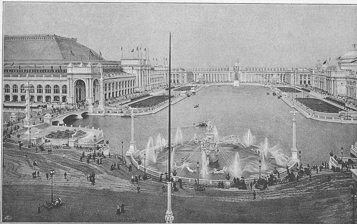
Gebäude für Industrie und freie Künste.

des äussern Schienenstrangs wurde schon von Anfang an nicht wieder durch Keilschwellen und Sattelhölzer, sondern durch verschiedene Höhenlage der Trägersäulen, bei grösseren und breiteren Brücken durch Neigung der Quertträger und Befestigung der sekundären Langträger in verschiedener Höhe, später bei kleineren Objekten auch durch Schiefstellung der ganzen Konstruktion bewerkstelligt, was den nicht zu unterschätzenden Vorteil mit sich brachte,