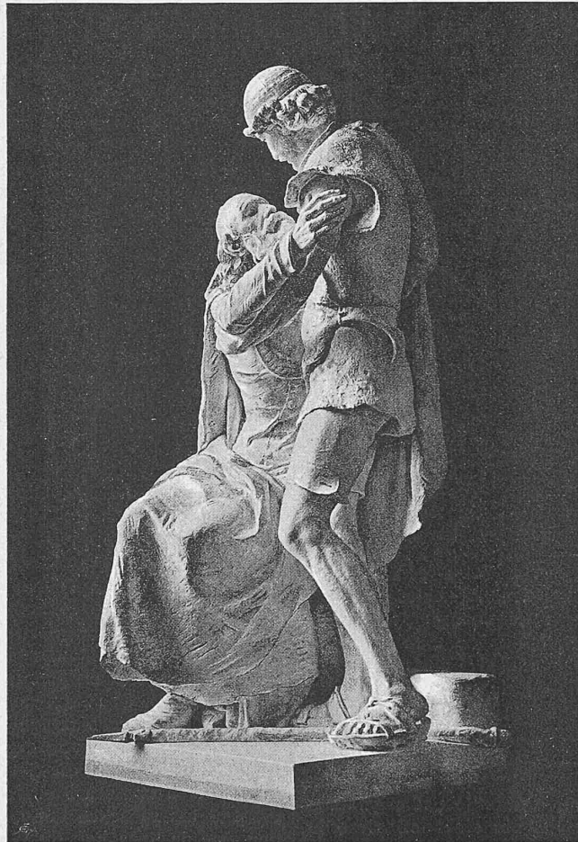
Nach einer Photographie.

Von Bildhauer Richard Kissling in Zürich.