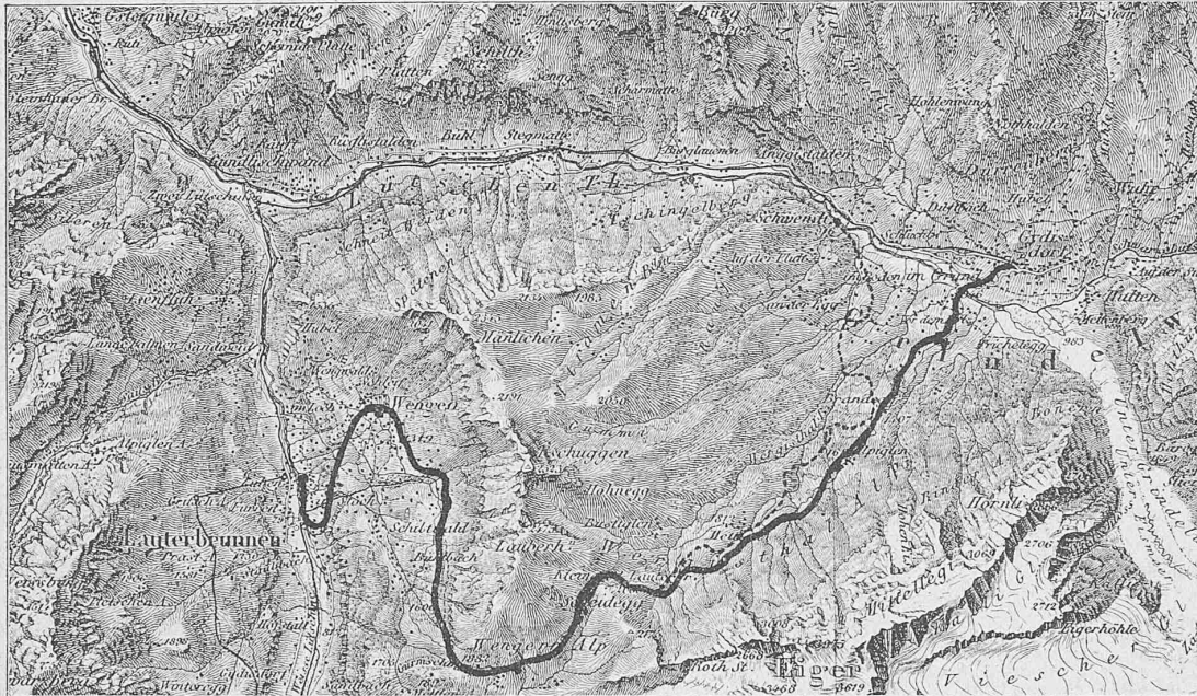
Fig. 2. Wengernalpbahn. Tracé.

Die Trace-Studien wurden vom Juli bis Ende September 1890 ausgeführt und sodann die Erdarbeiten gleichzeitig von Lauterbrunnen und Grindelwald aus mit einem Arbeitercorps von etwa 800 Mann mitte April 1891 in Angriff genommen. Bis zum Juli 1892 waren alle Erd- und Kunstbauten hergestellt. Es ist die durchschnittliche monat-