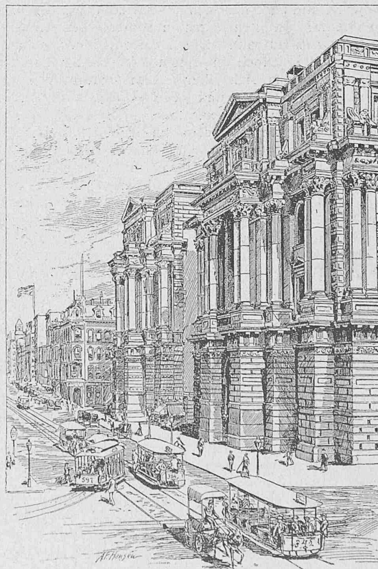
Courthouse an der Randolph-Strasse in Chicago.

fester cette faiblesse par une déformation permanente visible à l'oeil." (S. 42.)