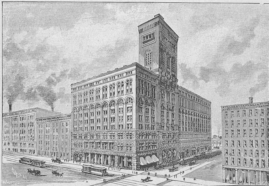
Das Auditorium-Gebäude in Chicago.

wenig zu, wenn einmal eine merkliche Ausbiegung eingetreten ist; sie nimmt rasch ab, sobald die Elasticitätsgrenze überschritten ist. Es ist mir daher ganz unverständlich, wie ein Stab, der unter seiner gewöhnlichen Belastung bis über diese Grenze hinaus beansprucht wird, noch fortfahren