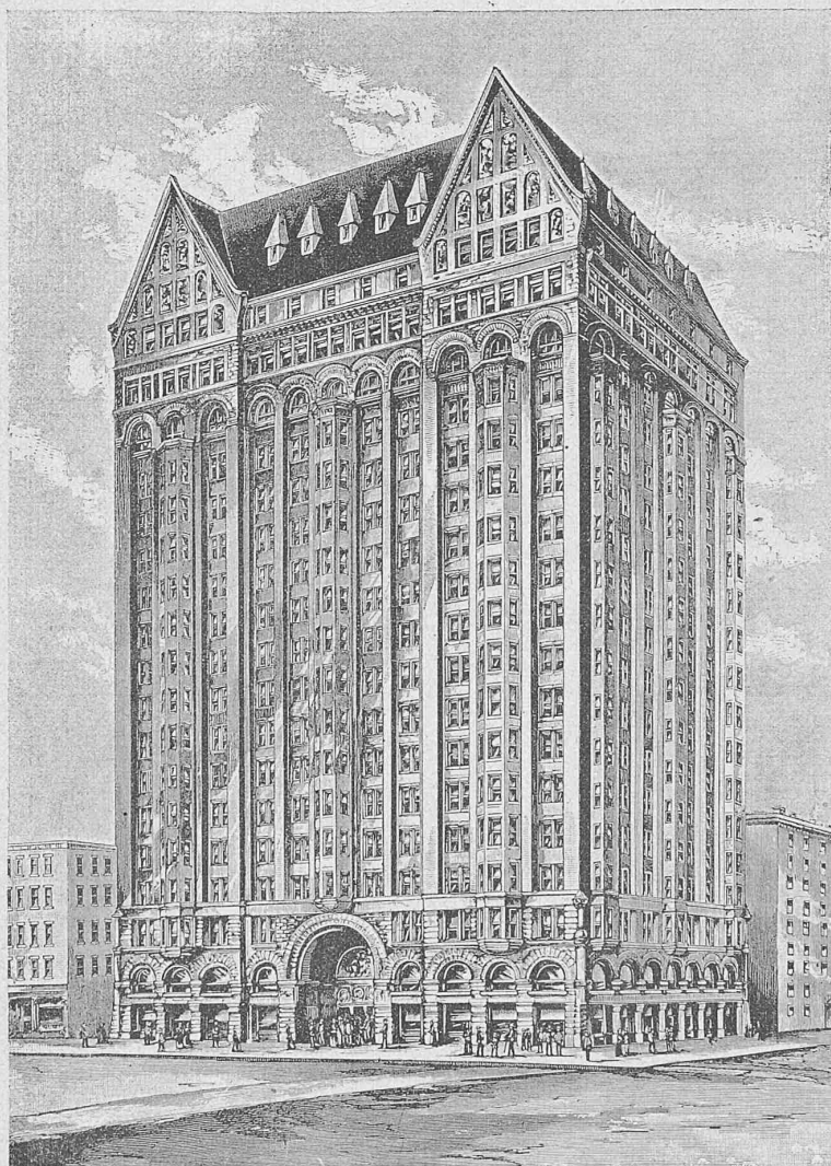
Der Freimaurer-Tempel in Chicago.

der Ansicht, dass wenn ein Druckstab zu stark beansprucht wird, er allmählich eine bleibende Verbiegung annimmt, aber gleichwohl fortfährt, seine Aufgabe zu erfüllen. „Dès que les poids roulants disparaissent, la pièce reprend sa disposition première, et c'est la répétition des efforts qui finit par laisser apercevoir une déformation permanente, qui est toujours un signe grave, bien qu'il n'indique pas un péril imminent.“ . . . „C'est ce qui explique qu'une barre ayant seulement la tendance à flamber peut montrer au bout d'une période plus ou moins longue des déformations permanentes, sans que ces déformations soient l'indice d'une situation désespérée.“ (S. 22 und 23.) Sie schliessen daraus weiter, dass wenn die mittleren Streben der Mönchensteiner Brücke zu geringe Knickfestigkeit gehabt