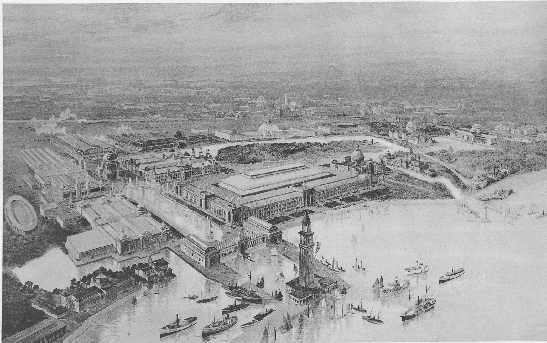
Die Kolumbische Weltausstellung in Chicago.