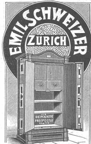
vormal Cosulich-Sitterding gegründet 1840.