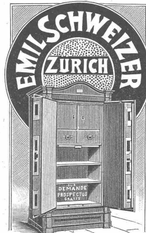
vormals Cosulich-Sitterding gegründet 1840.

Kägi & Reydellet in Winterthur. (M 5095 Z)