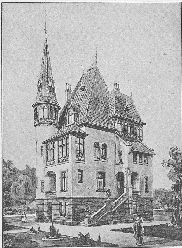
Perspective nach einer Photographie.

Architekten: Erdmann & Spindler in Berlin.