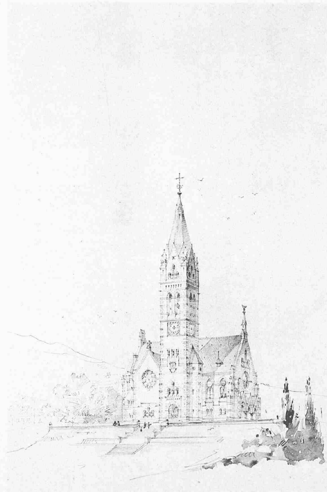
Wettbewerb für eine reformierte Kirche auf der Bürglitrassse in Enge bei Zürich.