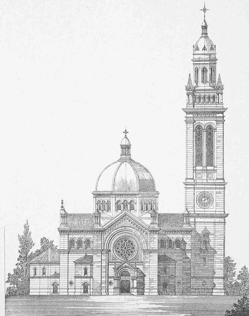
Masstab 1 : 500