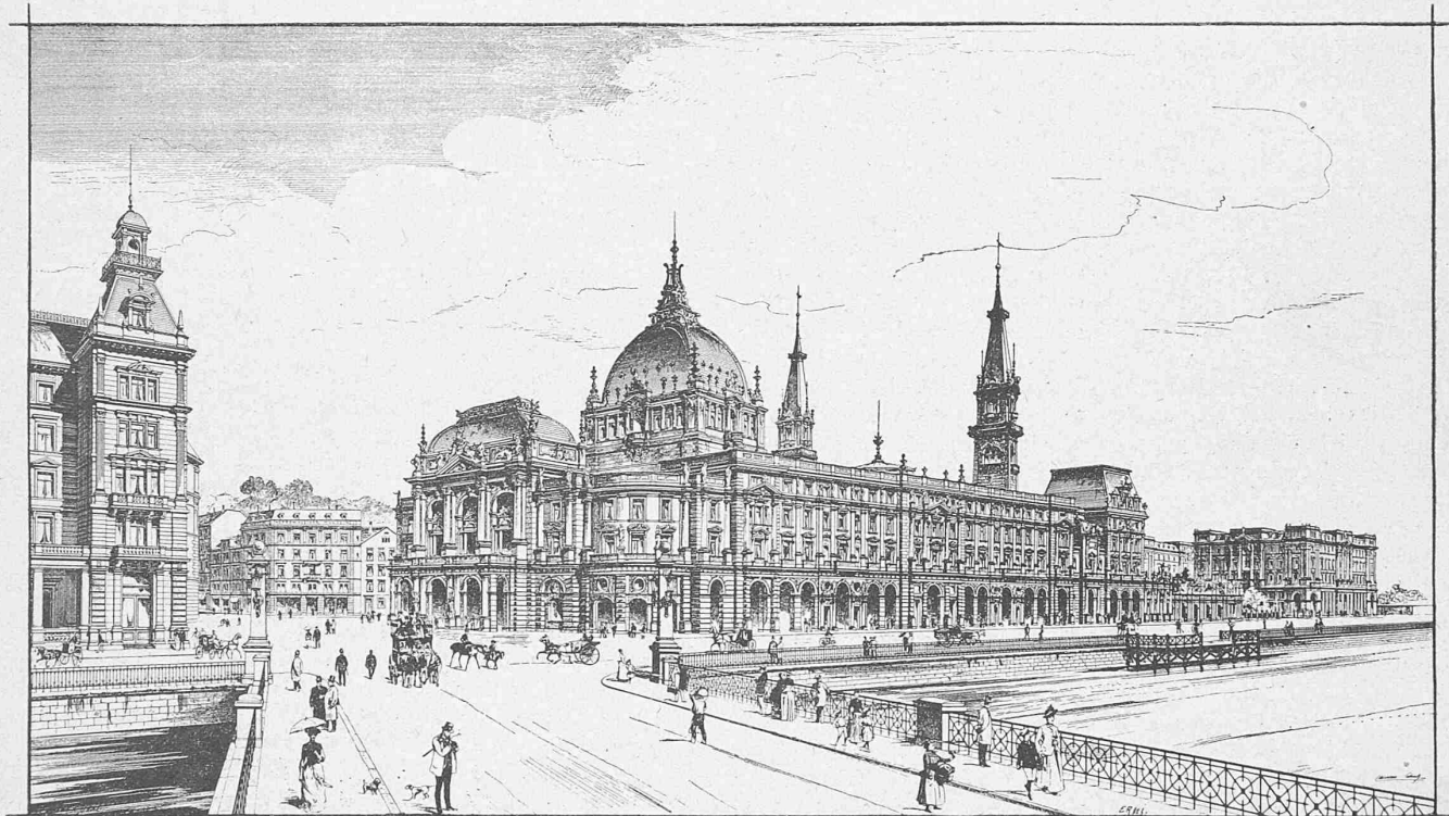
Ansicht von der Quai-Brücke aus.

Architekten: HH. Chiodera & Tschudy in Zürich.