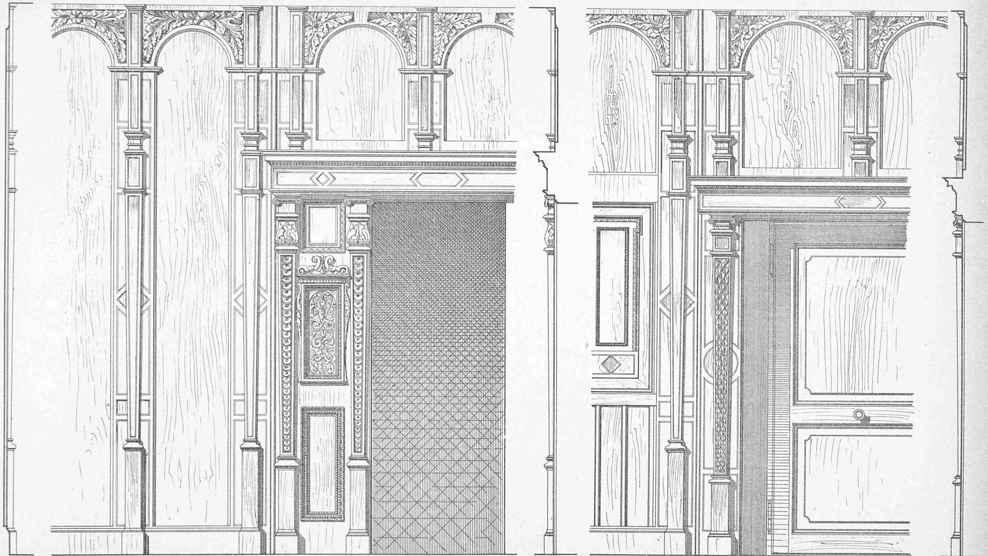
Detail vom Kinderzimmer.