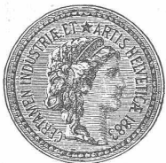
(M 1293 Z)