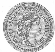
(M 1293 Z)